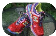
ジョギングシューズ・寛平ちゃんも使用

さて、今年のGWは、念願のイスラエル旅行を果たしました。いつもは個人旅行を好む私ですが、こいすラエルは個人旅行には難易度が高