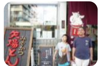
名古屋名物味噌カツ、まあちゃんの思い出の店矢場とん

「…大きな舞台に圧倒されることなく存在感があり、しっかりした演技に感心し…」初めて見る校長先生の字、丁寧な文章にびっくりした！嬉しかった！！ 一つの仕事をしつかりやると沢山の縁が生まれる。そして次の仕事でまた会える人がいて、世界が広がっていく。 最初つまらないと思った仕事だったけれど、また一つの宝物が増えたんだ♪