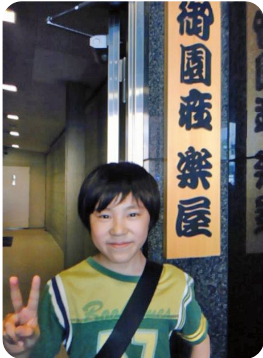
次ページは、あなたからの「嬉しい声」♪

今回ぼくは、主人公の息子の友達役だから気楽♪そうはいつても場面での台詞は多いので、やりとりの間を大事にやっている。