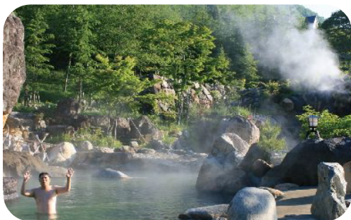
日本最大級の露天風呂 新穂高温泉

が一般的。お風呂好きだったローマ時代からの伝統なのでしょう。だから、お風呂というよりも温泉プールがあり、そこでエクササイズ(運動です)が行われ、ジムが併設されていたり、マッサージ・エステ施設がある、という具合です。更に病院が付属することも。日本も、海外の「温泉文化」をどんどん取り入れたいですね。